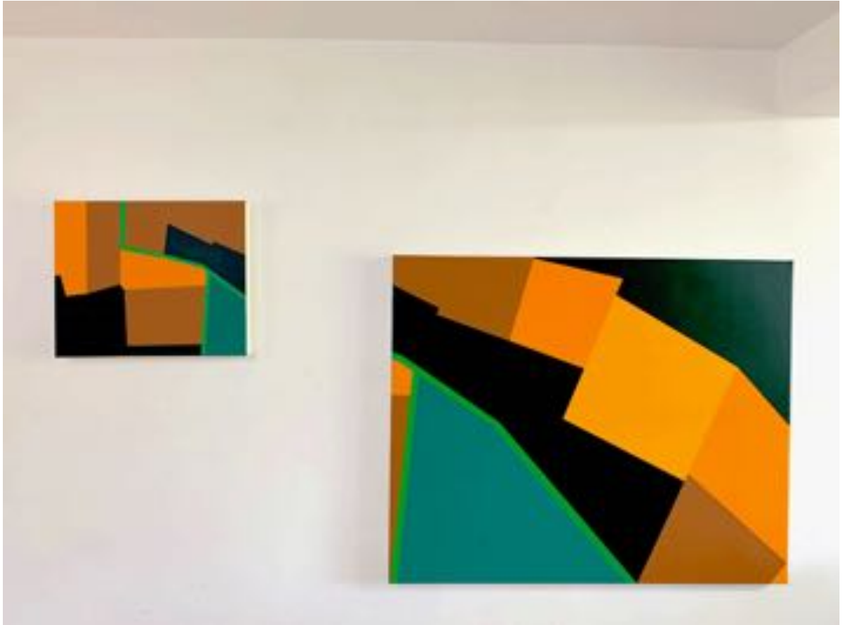
Peinture acrylique sur toile 38x46 66x81