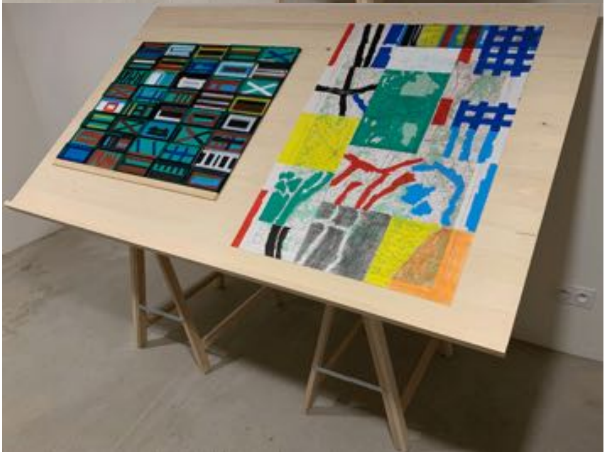
Acrylique sur carte IGN St Amour Acrylique sur boîtes métalliques