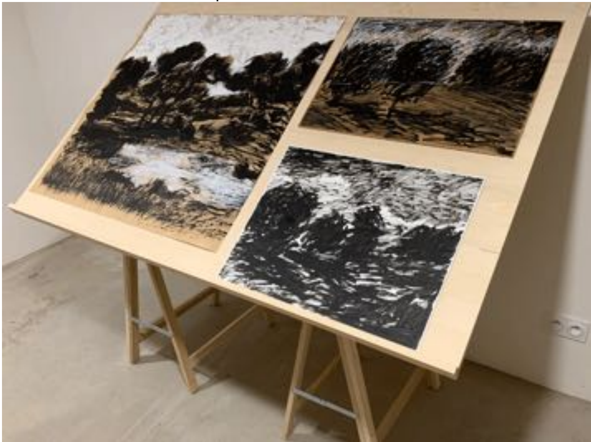
Encre et peinture acrylique sur papier 80x100 50x70

Les travaux en cours sont présentés sur des tables d'atelier inclinées.