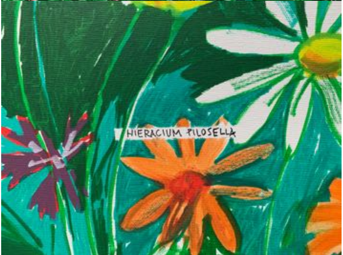
Peinture acrylique sur toile 114x162