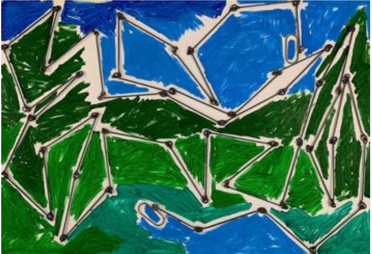
Chaîne d'arpenteur 10 m sur peinture acrylique sur papier 80x120 cm