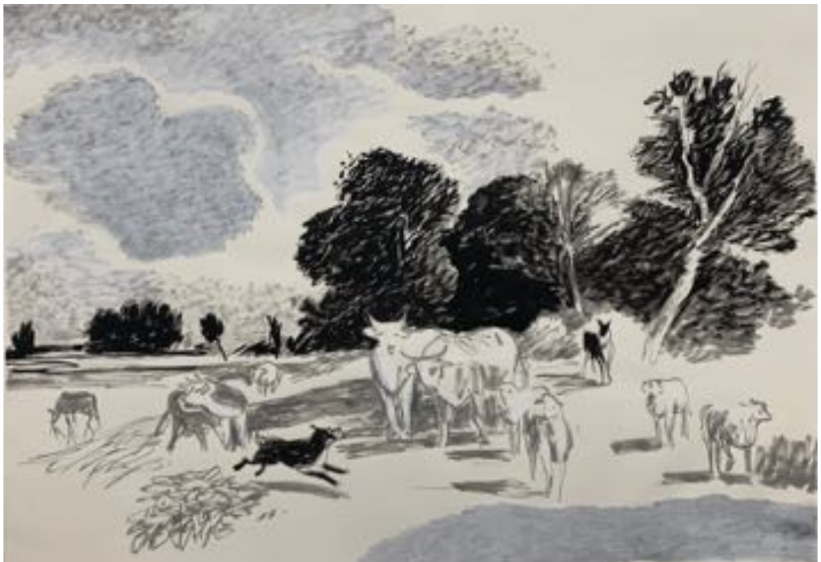
Peinture acrylique sur papier 80x120